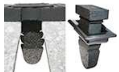
optimiertes Befestigungssystem: verstärkter Gummidübel mit umlaufendem Rand - bündig mit der Matte