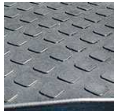
verstärkte, gewölbte Oberfläche mit Quadratprägung